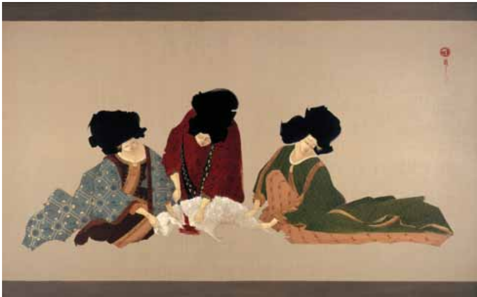
Hayv Kahraman Collective Cut, 2008 Oil on linen 106.5 x 173 cm Courtesy of the Saatchi Gallery, London © Hayv Kahraman (photo: David Dupree)