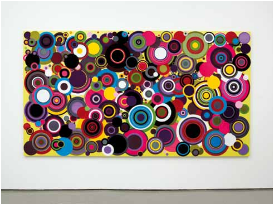
Bharti Kher Untitled, 2008 Bindis on painted board 173 x 311 cm © Bharti Kher