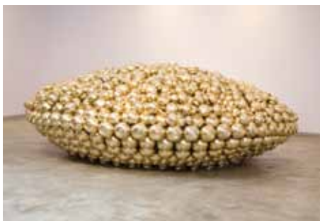
Subodh Gupta U.F.O., 2007 Brass utensils, stainless steel structure 114 x 305 x 305 cm / 44 7/8 x 120 1/8 x 120 1/8 inches Courtesy the artist and Hauser & Wirth and the Saatchi Gallery, London © Subodh Gupta (photo: Stefan Altenburger Photography Zürich)